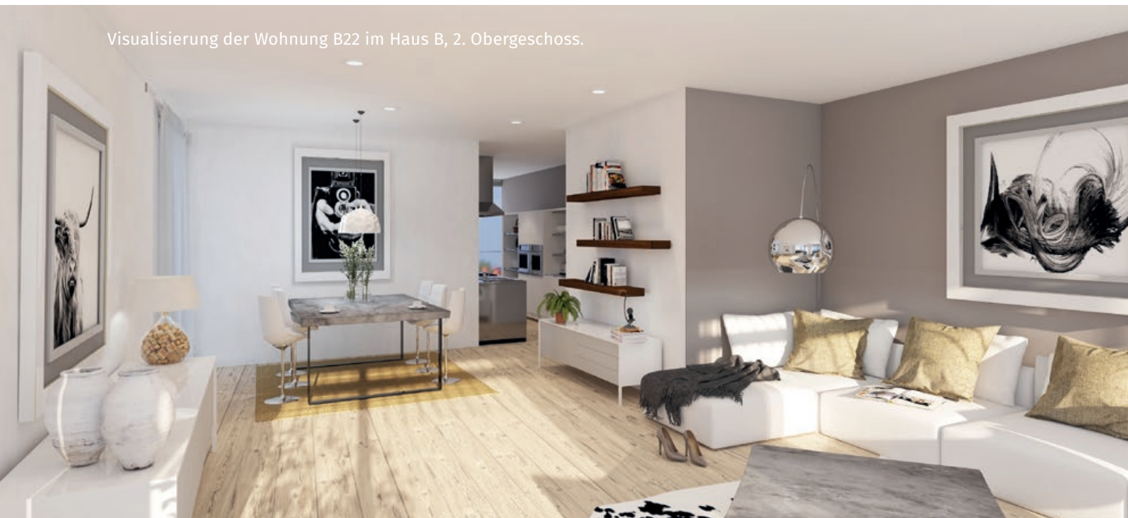
Visualisierung der Wohnung B22 im Haus B, 2. Obergeschoss.

* Diese Zahl bezieht sich auf die nutzbare Wohnfläche, ohne Aussenmauern, ohne Innenwände, inklusive Abstellraum, ohne Keller, ohne Sitzplatz, ohne Terrasse, ohne Loggia. Die Quadratmeterangaben sind Richtwerte. Im fertiggestellten Objekt können sie minim anders ausfallen.